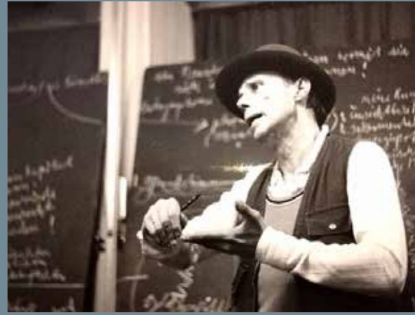
Joseph Beuys geb. 12.05.1921 in Krefeld gest. 23.01.1986 in Düsseldorf